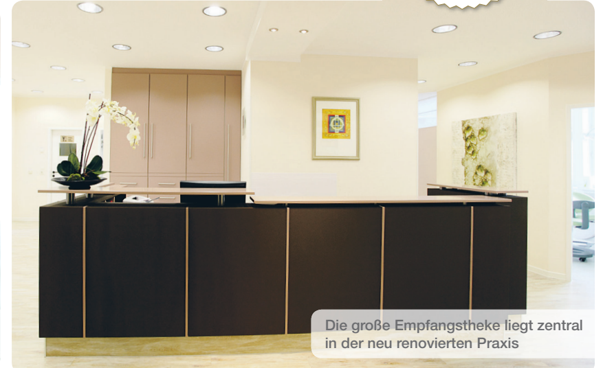
Die große Empfangstheke liegt zentral in der neu renovierten Praxis